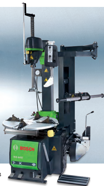
TCE 4470 S44 Ergo Control