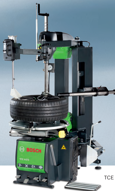
TCE 4475 S44

TCE 4470 oraz TCE 4475 mają pneumatycznie odchylaną kolumnę i są przeznaczone dla serwisów opon samochodów osobowych o dużej ilości usług.