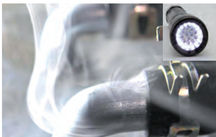
Spaliny mogą być identyfikowane w świetle białym

Można również zamówić regulator azotu fabrycznie ustawiony na 7 bar do stosowania z dużymi butlami azotu w warsztacie. Do połączenia z SMT 300 jest wówczas potrzebny wąż z końcówkami, który także można zamówić osobno.