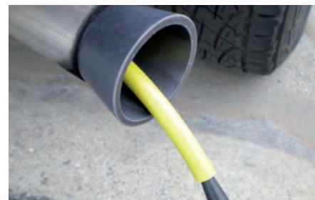
STM 300 pozwala również znaleźć nieszczelności w układzie wydechowym